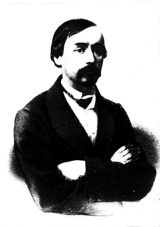
Н. А. НЕКРАСОВ

Литография П. Ф. Бореля по фотографии 1850-х гг.